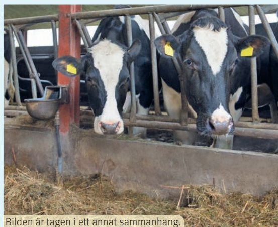
Bilden är tagen i ett annat sammanhang.

Sedan programmet sändes har ett stort antal djur avlivats. Ett tiotal kor nödslaktades omedelbart och ytterligare 70 djur ska ha slaktats till följd av vanvården, uppger SVT. ■