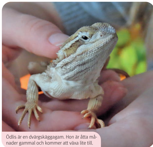
Ödlis är en dvärgskäggagam. Hon är åtta månader gammal och kommer att växa lite till.