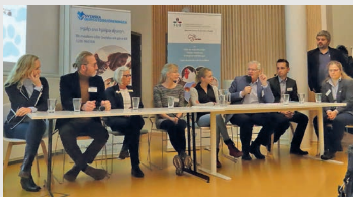
Slutdiskussion på seminariet om hundsmuggling den 11 december 2019.

” Det är inte ett djurskyddsproblem att vara död, däremot är hanteringen från början till slut ett etiskt problem.