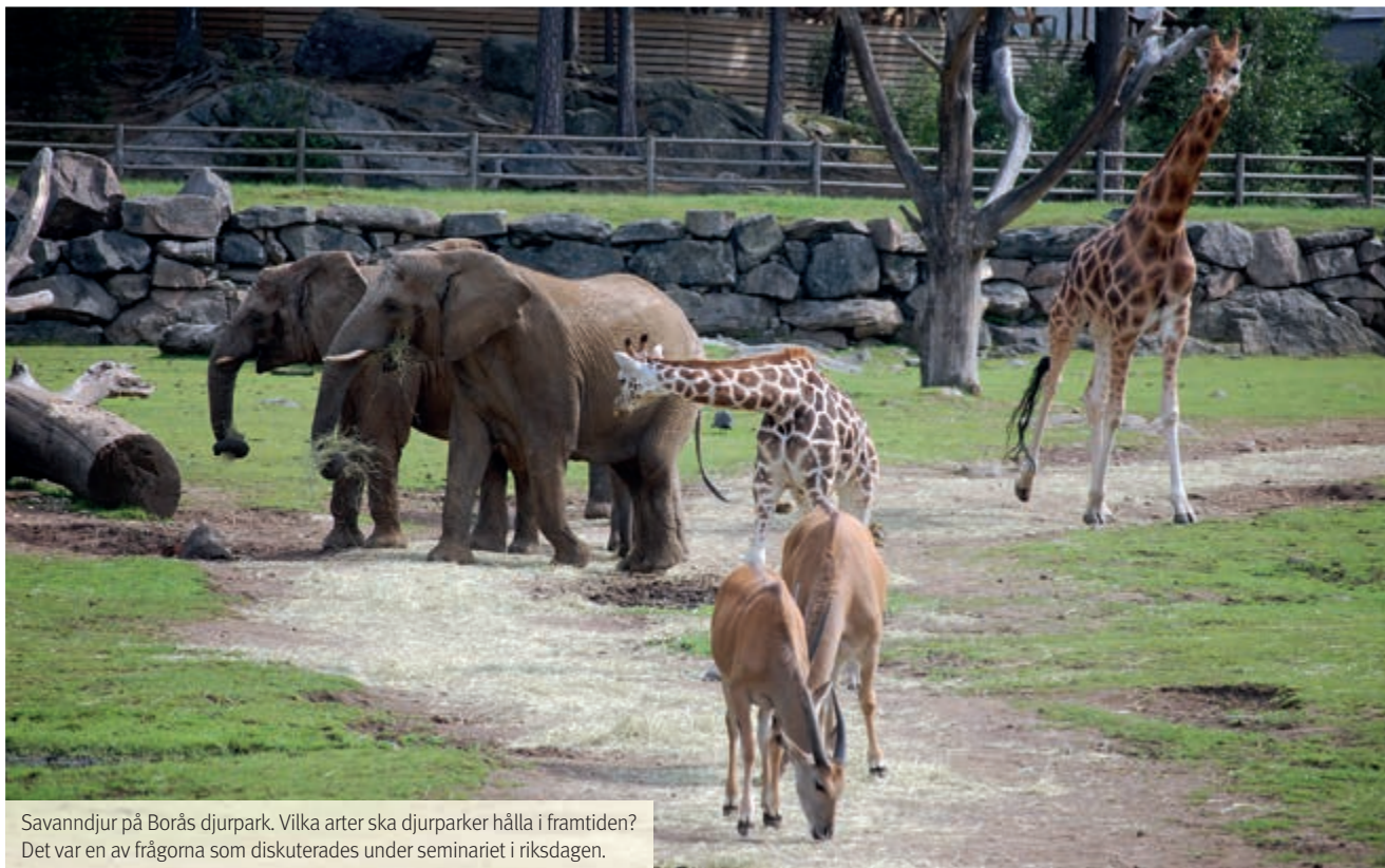
Savandjur på Borås djurpark. Vilka arter ska djurparker hålla i framtiden? Det var en av frågorna som diskuterades under seminariet i riksdagen.