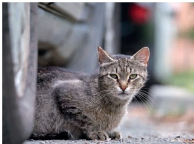
Sedan 1 januari 2023 är det lag på att alla katter ska vara id-märkta och registrerade.

Enligt jaktlagen är alla fåglar fredade under häcknings-säsongen som är mellan 1 april och 31 juli. Då får man i regel varken plocka bort ägg eller bon. Vissa undantag finns dock i jaktförordningen. Om fågelboet är byggt på en plats så att det orsakar allvarlig skada eller olägenhet, till exempel ovanpå en dörrkarm, kan det vara tillåtet för fastighetsägaren att flytta boet. Förr eller senare lämnar fåglarna boet och det bästa är förstås om man har möjlighet att vänta ut dem.