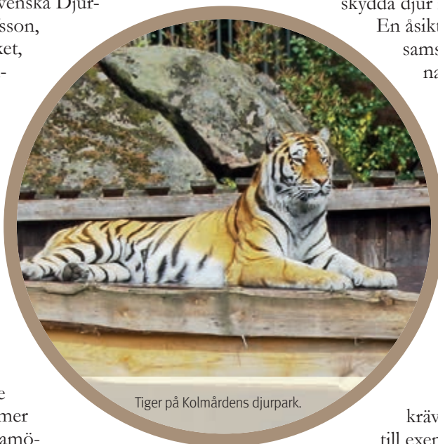
Tiger på Kolmårdens djurpark.

– Att gå på djurpark i framtiden skulle kunna innebära att man gör något bra, att känna att man bidrar med något gott. Jag tror folk är redo för det, många är väldigt woke (politiskt medvetna, red. anm.) nu för tiden. ■