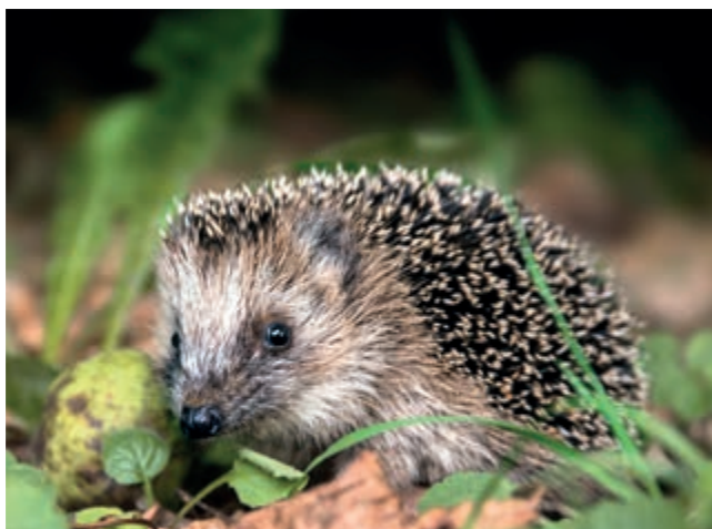
Genom att spara lövhögar i trädgården kan du hjälpa igelkotten att bygga bo.

Nej! Djurungar i naturen är sällan övergivna. Måsföräldrar vakar över sina ungar från luften och ser till att de får mat, vatten och skydd. Om en liten unge är på en väldigt utsatt plats, till exempel mitt i tät trafik, är det bra att flytta den till ett närliggande buskage, park eller liknande. Lägg fågelungen i en kartong, ”häll” ut fågeln på den nya platsen och ta bort kartongen. Se till att måsföräldrarna hänger med, utan föräldrarna klarar den sig inte. Ett paraply över huvudet kan vara bra att ha, som skydd för cirkulerande vuxna måsar.