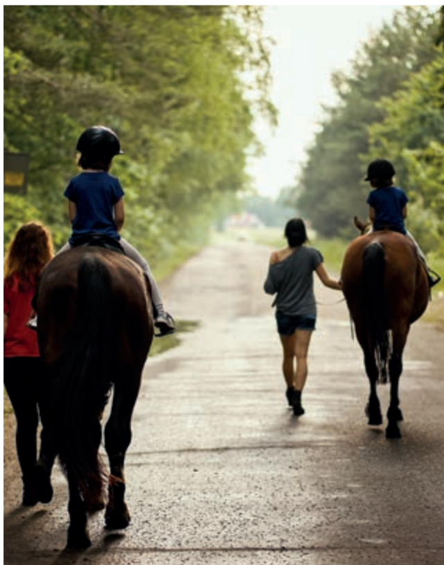
De flesta trafikolyckor där hästar är inblandade sker under vår- och höstmånaderna. Vägkorsningar är särskilt riskfyllda.

R yttare och häst räknas som fordon. Ridande ska därför använda körbanan om ingen särskild ridbana finns; det är inte tillåtet att rida på gång- eller cykelbana. Och det är kombinationen hästar och motorfordon på samma yta som kan vara riskfyllt. Flest trafikolyckor med häst inträffar under vår- och höstmånaderna. Till största del händer olyckorna i dagsljus och i torrt väder, endast en mindre andel sker i regn, dimma och snövägslag. I Skåne, Västra Götaland och Dalarna inträffar sammanlagt 40 procent av alla hästrelaterade trafikolyckor och merparten sker på allmän väg med en hastighetsbegränsning på 70 km/h.