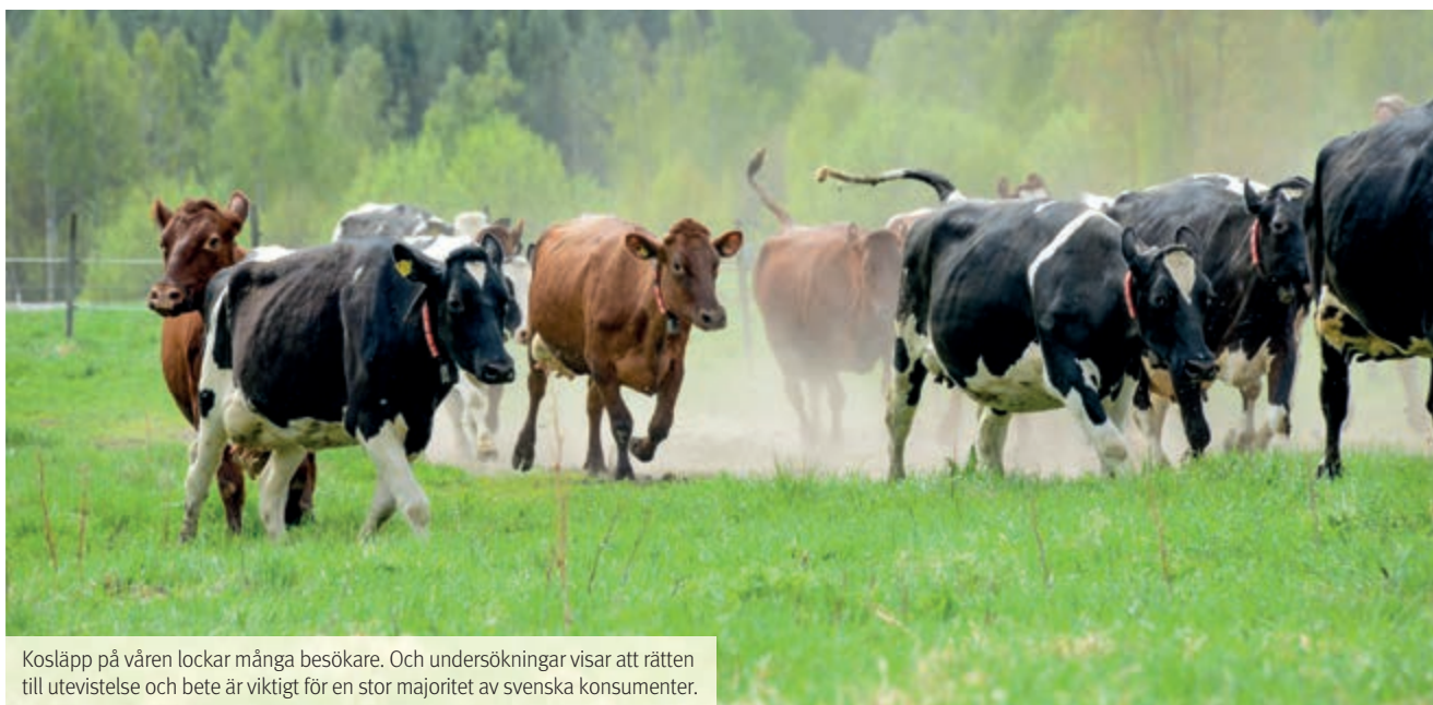
Kosläpp på våren lockar många besökare. Och undersökningar visar att rätten till utevistelse och bete är viktigt för en stor majoritet av svenska konsumenter.

– Idag har tjurar ingen laglig rätt att gå ut på bete. Hälften av de tjurar som vi köper som nötkött i butiken kommer aldrig ha betat under in livstid. Vi skulle vilja utöka deras rättigheter också så att även de har rätt till betesgång. ■