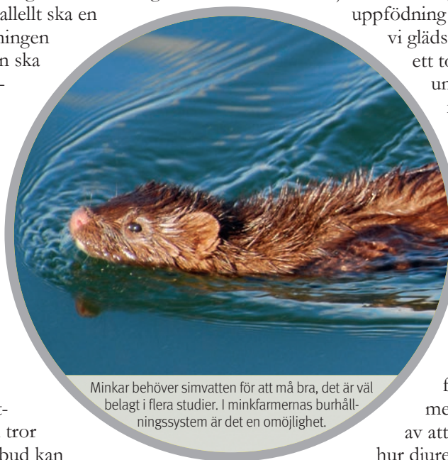
Minkar behöver simvatten för att må bra, det är väl belagt i flera studier. I minkfarmernas burhållningssystem är det en omöjlighet.

– Att vi fortfarande tillåter mink i bur i Sverige beror på att Jordbruksverket är fega och styrda av LRF. Jordbruksverket prioriterar näringens intressen framför djurskyddet, trots att de har ansvar för bägge. ■