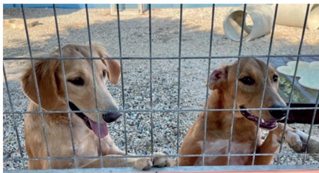
Två hundar som söker nya hem på ett lokalt shelter på Cypern.

Under resan gavs konferensdeltagarna även möjlighet att besöka ett lokalt hundhem. På Cypern finns många