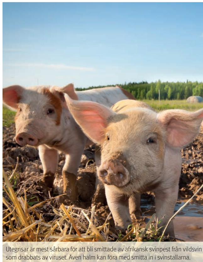
Utegrisar är mest sårbara för att bli smittade av afrikansk svinpest från vildsvin som drabbats av viruset. Även halm kan föra med smitta in i svinstallarna.

– Kommer afrikansk svinpest in i en tamgrisbesättning drabbar det så otroligt många individer. När det gäller andra smittor så kan anläggningarna verka som en reservoar. Det gör dem till perfekta grogrunder för olika