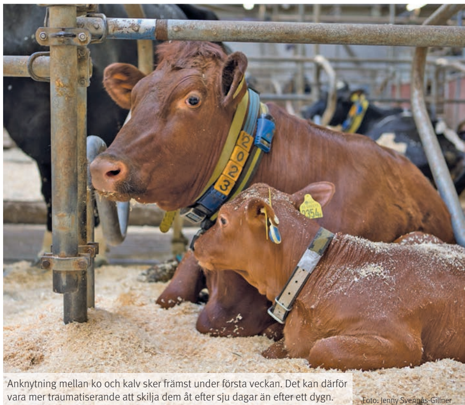
Anknytning mellan ko och kalv sker främst under första veckan. Det kan därför vara mer traumatiserande att skilja dem åt efter sju dagar än efter ett dygn.