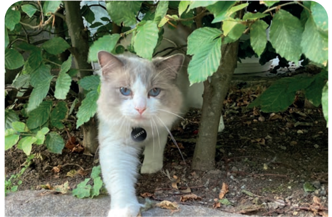
Katten Idefix är en typisk ragdoll och håller sig nära familjen och hemmet. Han går gärna ut på innergården mitt i stan utan att smita iväg.

– När han biter på sladden till min Ipad. Eller slickar på min hand när jag sover. Men mamma brukar stänga dörren till mitt sovrum. ■