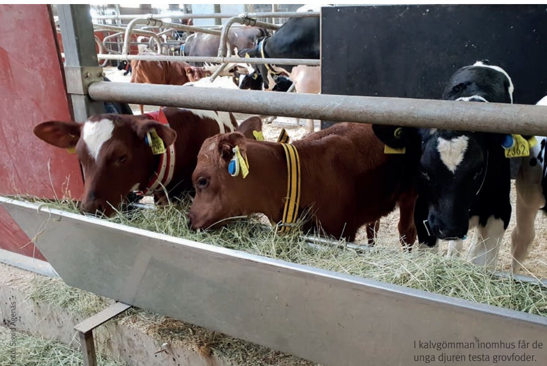
I kalvgömmor inomhus får de unga djuren testa grovfoder.

” Många tycker det är fel att skilja ko och kalv åt och det är inte en fråga som kommer att försvinna.