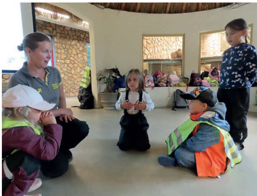
För att barnen på riktigt ska sätta sig in i känslorna inleds ett slags rollspel där några låtsas att de är hundar på marken och andra kommer fram och klappar ”hundarna”.