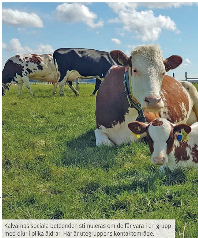
Kalvarnas sociala beteenden stimuleras om de får vara i en grupp med djur i olika åldrar. Här är utegruppens kontaktområde.