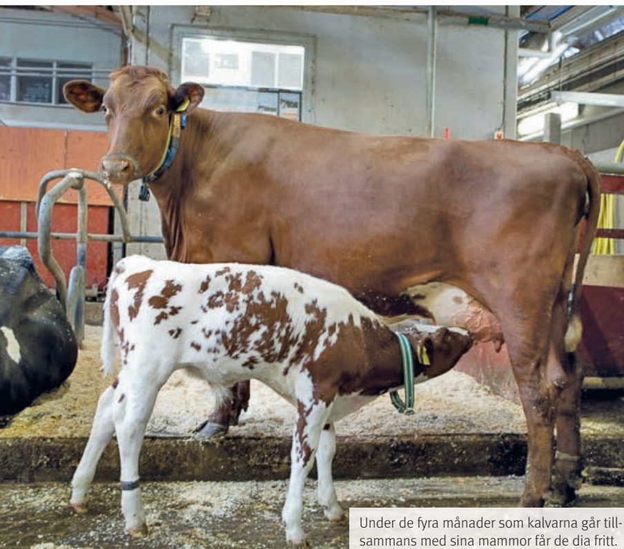
Under de fyra månader som kalvarna går tillsammans med sina mammor får de dia fritt.

– Det är under de månaderna kalven går hos kon som man får ett intäktsbortfall. När kalven skiljs av ökar mjölmängden till mjölktanken. Därefter har de