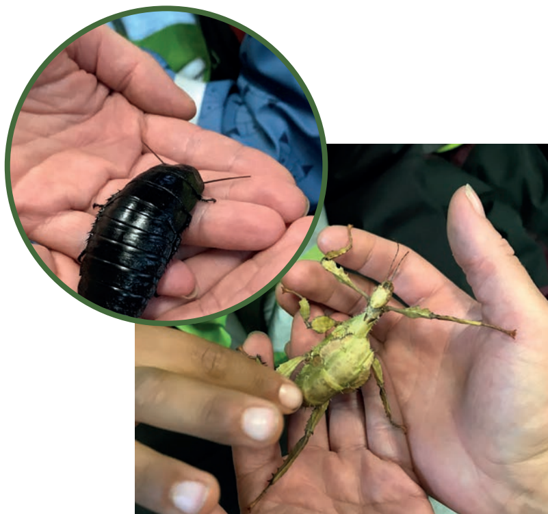
Barnen får klappa försiktigt på både en kackerlacka och en insekt som ser ut som ett löv. Det är läskigt och spännande på samma gång.